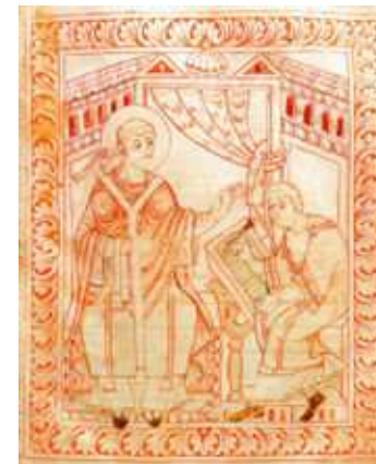
Papst Gregor der I. beim Diktieren der gregorianischen Gesänge.

form der römischen Liturgie durch, 5 woraus die Gregorianik hervorging.